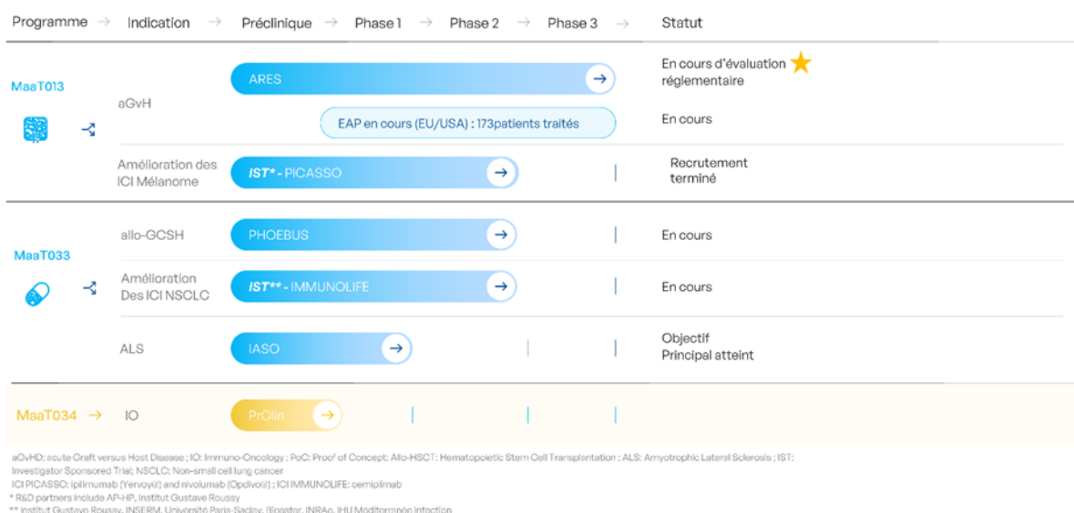
Figure 1. Portefeuille des produits de MaaT Pharma